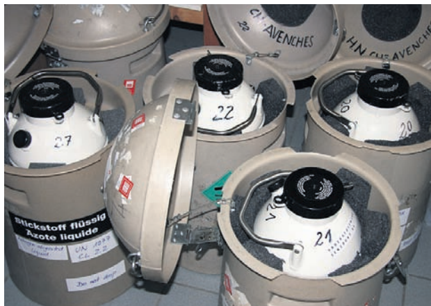
In solchen Transportcontainern, gefüllt mit Stickstoff, kann Gefriersamen in die ganze Welt versendet werden.

* Diese Serie wurde in Zusammenarbeit mit dem Institut suisse de médecine équine ISME geschrieben. www.ismequine.ch