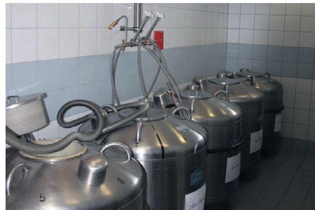
In diesen Containern wird der Gefriersamen in flüssigem Stickstoff bei minus 196 Grad Celsius aufbewahrt. Er ist unbeschränkt haltbar.