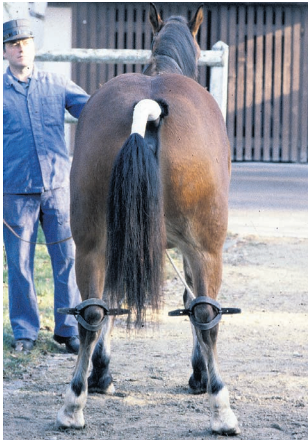
Eine Stute wird auf den Natursprung an der Hand vorbereitet. Dazu werden ihr die Hinterbeine mit Seilen fixiert.

Bei der Auslese eines geeigneten Hengstes für diese Methode muss ganz besonders auf seine Gesundheit und Charakter geachtet werden. In Frankreich, wo diese Zuchtmethode von einigen Gestüten mit Kaltblutrassen vor allem aus Kostengründen durchgeführt wird, zeigte sich, dass ein Hengst zuerst auf seine Eignung getestet und dafür trainiert werden muss. So ist nicht jeder Hengst fähig, seinen Penis selbstständig in die Scheide einzuführen und kann in-