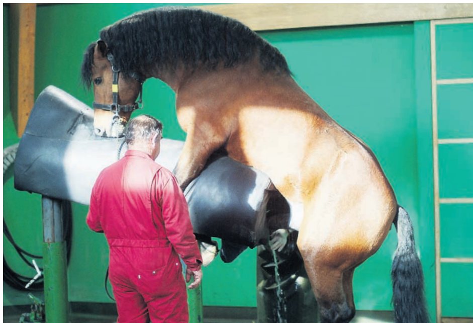
Einem Freibergerhengst wird auf dem Phantom Samen entnommen.

Die Vorteile der künstlichen Besamung sind vorwiegend hygienischer Natur, die stark erweiterten Einsatzmöglichkeiten des Hengstes sowie die Sicherheit der Zuchttiere. Rechnete man früher mit einer halben bis ganzen Milliarde Spermien pro Besamung, konnte in den letzten Jahren dank neuer Besamungsmethoden – beispielsweise tieferuterine Besamung – eine starke Reduktion dieser Zahl erreicht werden. Die künstliche Besamung (KB) umfasst nicht nur das Einführen des Samens in die