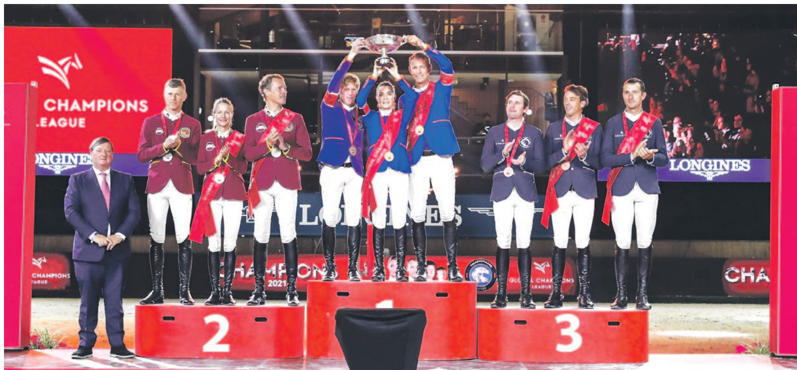
Podest Jahreswertung Global Champions League (v. l.): Shanghai Swans (2.), Valkenswaard United (1.) und Paris Panthers (3.).