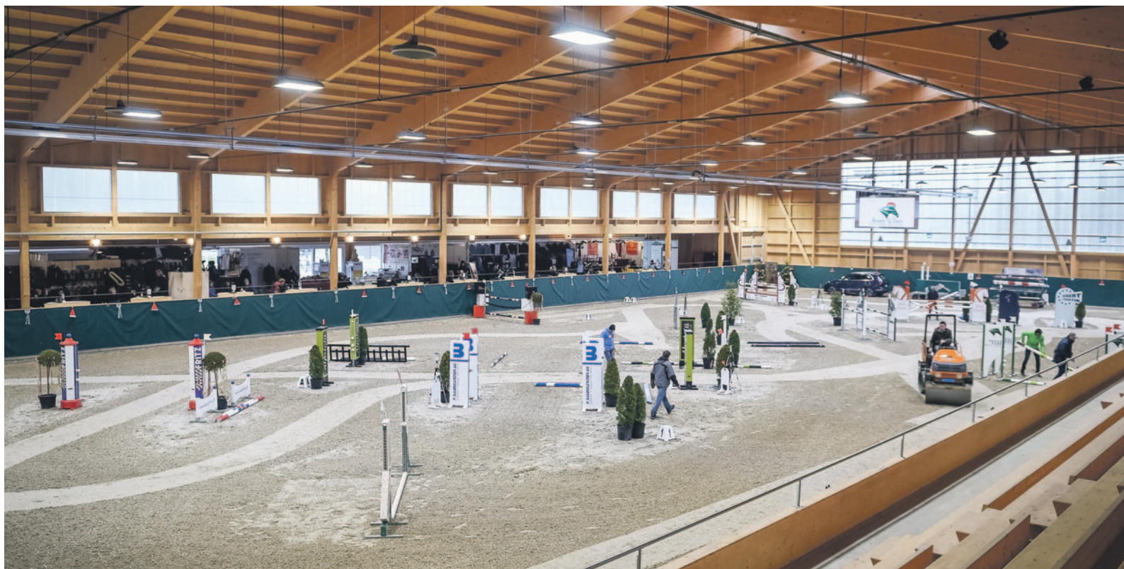
Premiere für das «Santa Claus Horse Park Masters» in Dielsdorf.