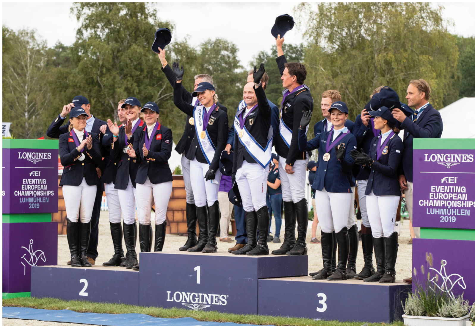
Podest EM-CC-Team (v. l.): Grossbritannien (Silber), Deutschland (Gold), Schweden (Bronze).