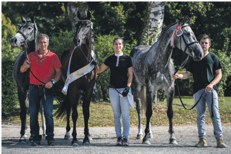
Die besten drei vierjährigen Prämienzuchtstuten (v. l.): Contea von Rugen (2.), TH Madeira (1.) und Clara CH (3.).