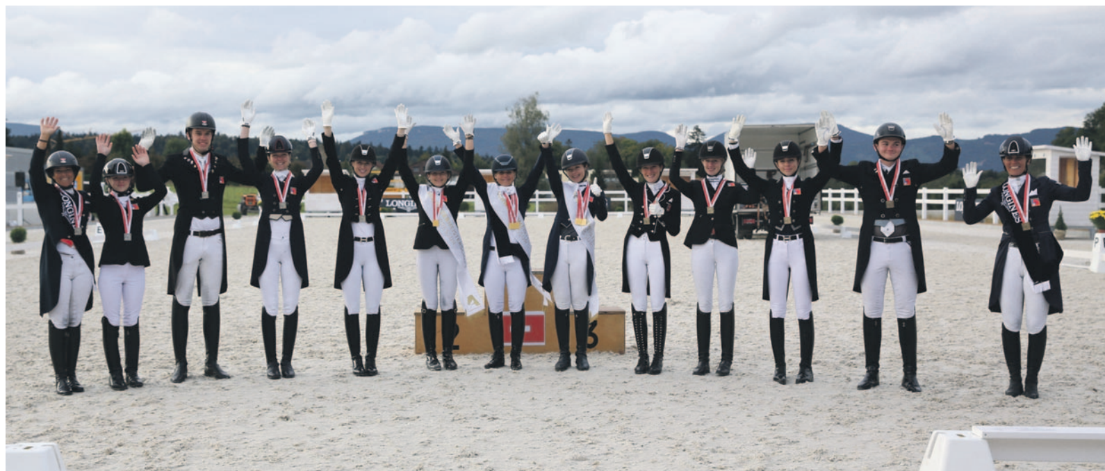
Die Medaillengewinner der Schweizer Meisterschaft Dressur Nachwuchs.