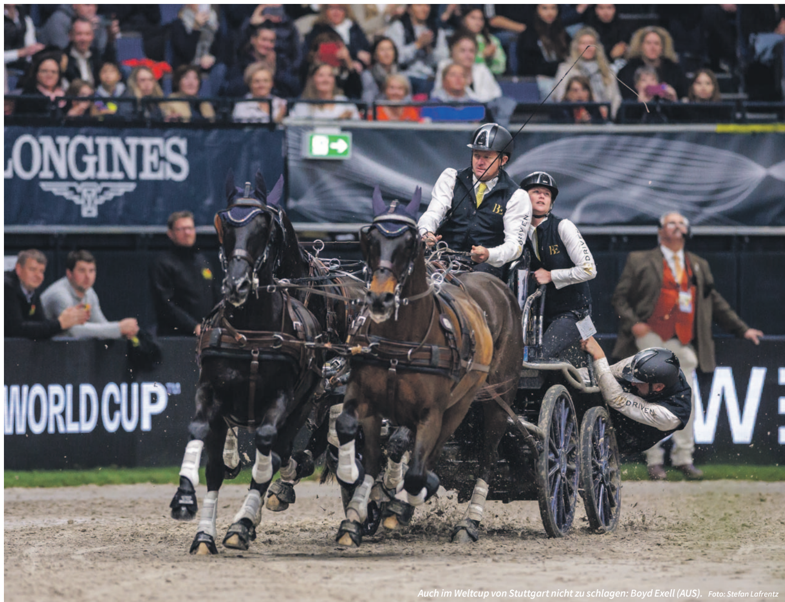
Auch im Weltcup von Stuttgart nicht zu schlagen: Boyd Exell (AUS).

Weltcup, Vierspanner, C, 1 St.: 1. Boyd Exell (AUS), 147.77; 2. Jérôme Voutaz (SUI), 161.76; 3. Glenn Geerts (BEL),